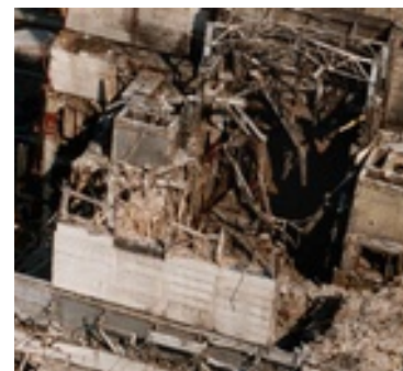
Atomruine in Tschernobyl

Atomkraft ist und bleibt gefährlich. Die Katastrophen in Tschernobyl und Fukushima haben schon viele Opfer gefordert, auch weiterhin werden Menschen an den Folgen sterben. In der Geschichte der „friedlichen“ Nutzung der Atomenergie haben sich zahllose weitere Unfälle ereignet. Auch im sogenannten Normalbetrieb geben AKW Radioaktivität an die Umwelt ab. Wie der hoch gefährliche Atommüll beseitigt werden kann, ist nirgendwo auf der Welt geklärt. Die viel bemühte Entwicklung neuer, nun aber wirklich absolut sicherer Reaktortypen wie etwa Fusionsreaktoren, stockt. In den nächsten 20 Jahren stehen diese Technologien nicht zur Verfügung. Der Klimawandel muss aber jetzt bekämpft werden.