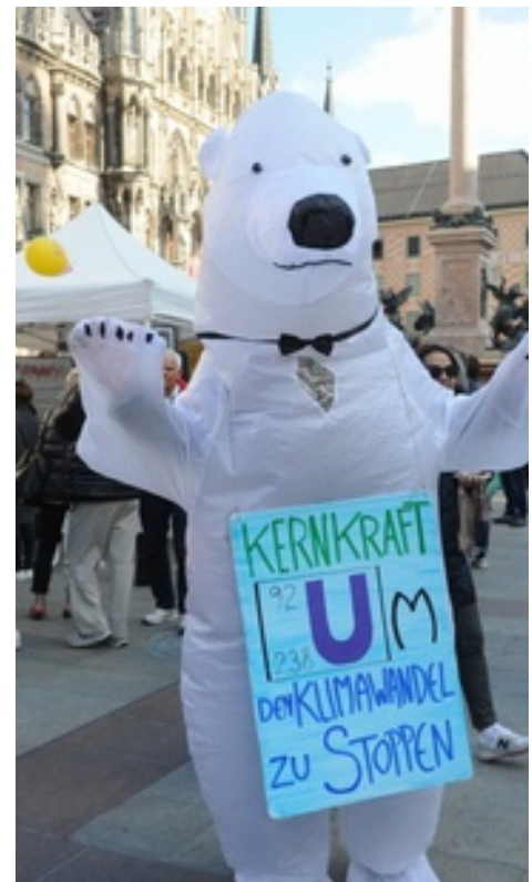
Nicht ganz echt: Uran-Eisbär Melty

Zu den Fürsprechern der Atomkraft gehört auch Bill Gates. Er soll sich, wie die „Washington Post“ berichtete, kürzlich mit Abgeordneten des US-Kongresses getroffen haben, um sie von den vermeintlichen Vorzügen der Atomenergie zu überzeugen. In einem offenen Brief an Angestellte schrieb er: „Kernenergie ist ideal, um dem Klimawandel zu begegnen, weil es die einzige CO 2 -freie, skalierbare Energiequelle ist, die 24 Stunden am Tag verfügbar ist.“ Microsoft-Gründer Gates, der als zweitreichster Mann der Welt gilt, besitzt unter anderem die Firma TerraPower, die an neuartigen Atomreaktoren forscht.